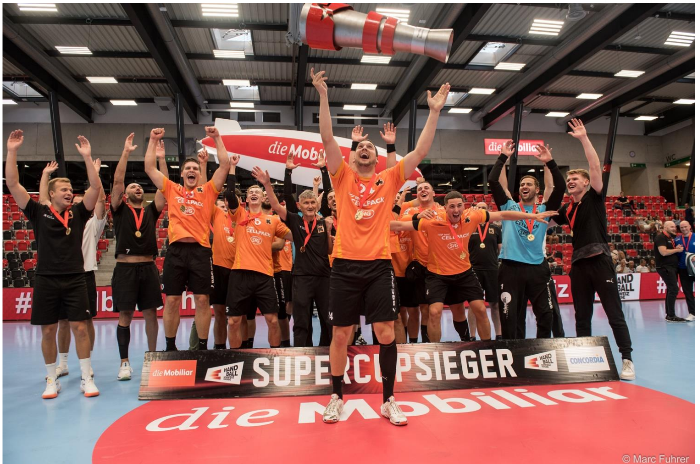
Supercupsieger = Kadetten Schaffhausen